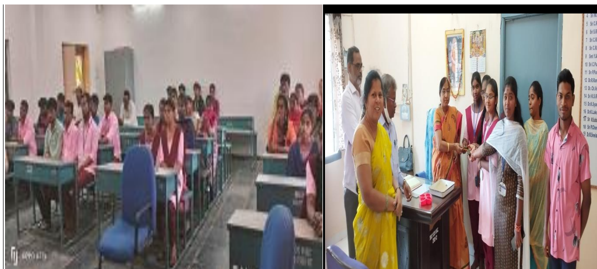
Students and Staff