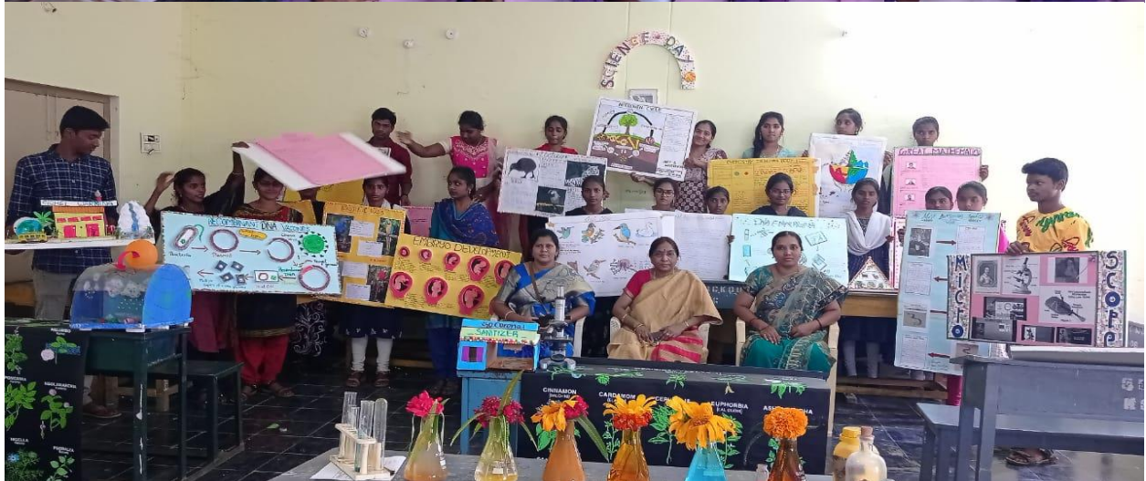
Principal Madam, staff and Participated Students