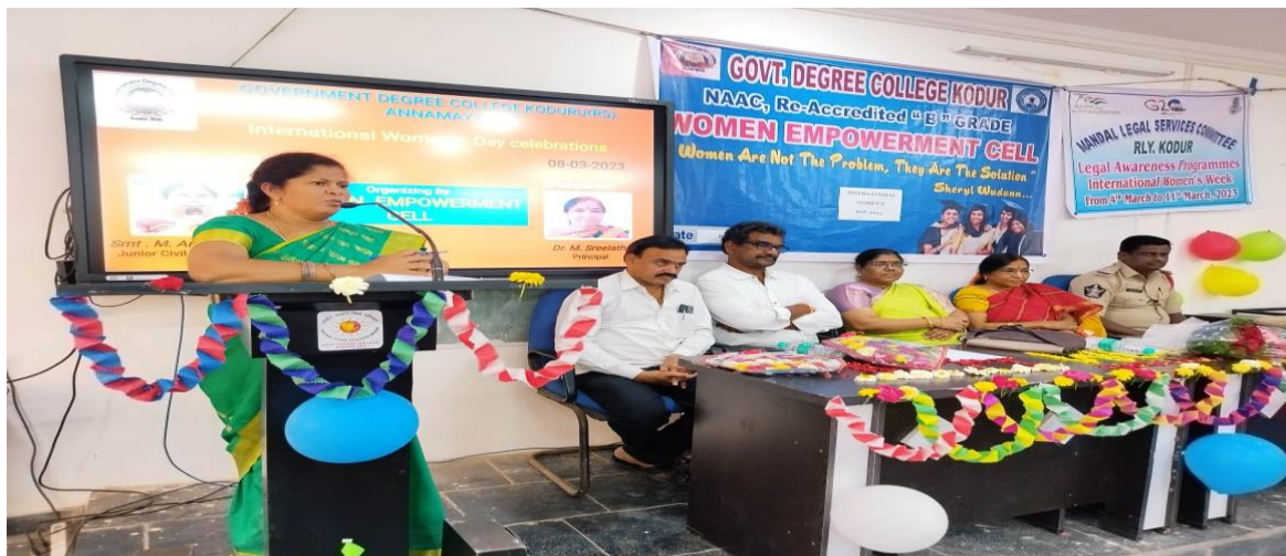
Women Empowerment Activities