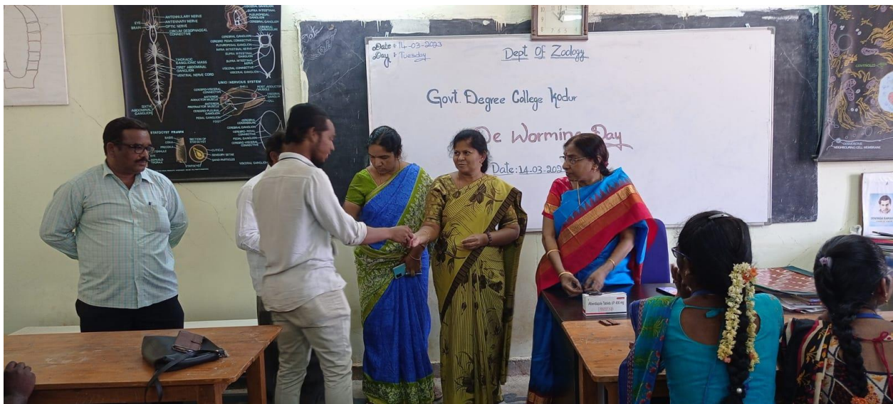
De warming Day