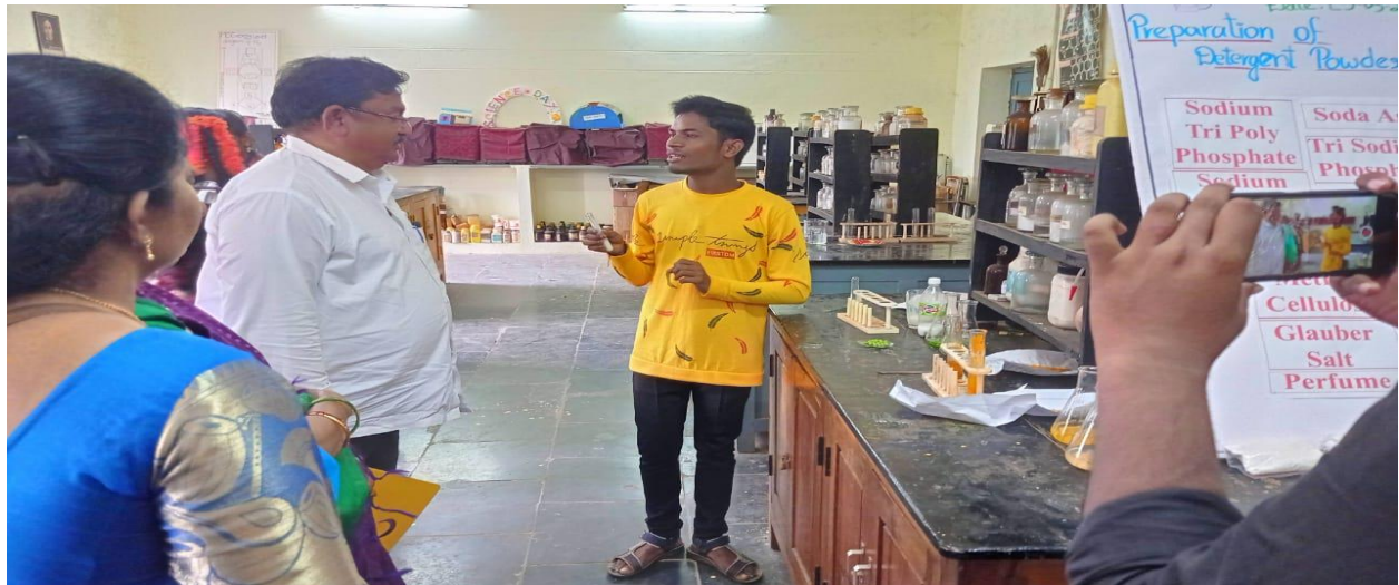
M.Raju II BZC Explained turmeric powder adulterants

Now Days all types of food ingredients, fruits and Vegetables have Chemicals. SO The department of chemistry organized an awareness programme with live experiments. At the time of Academic audit.