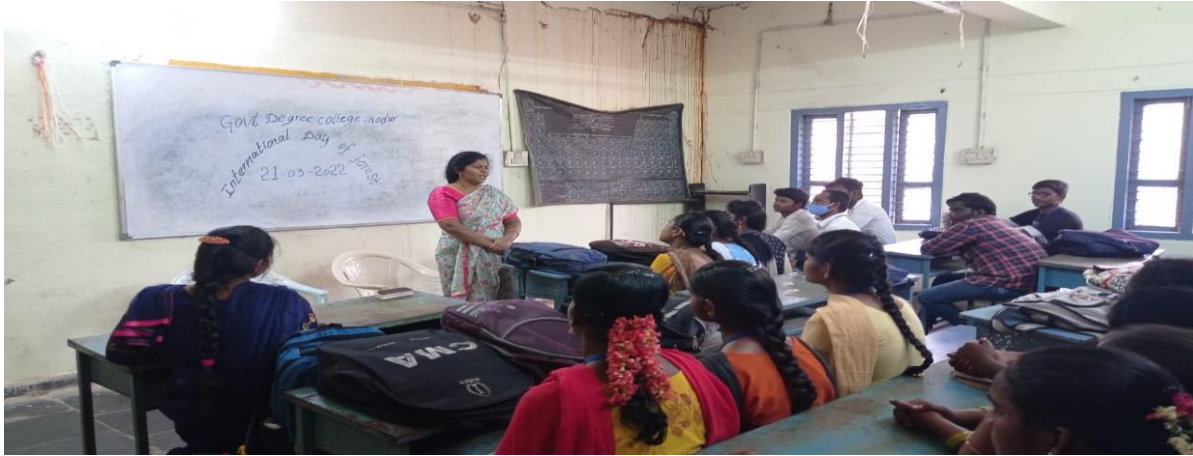
International Forest Day