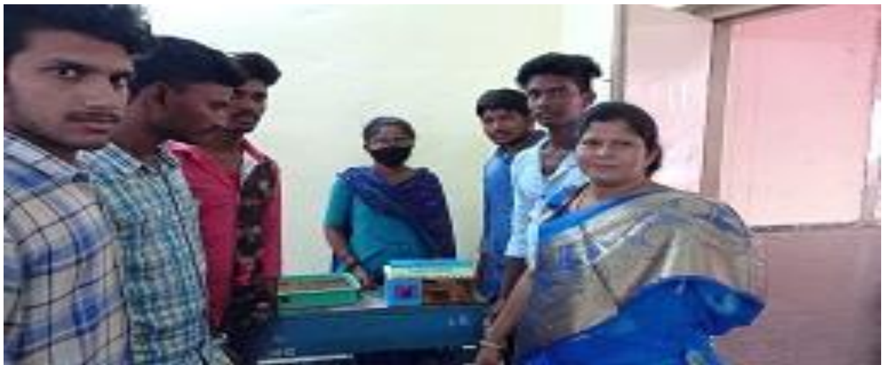
Students explain their models